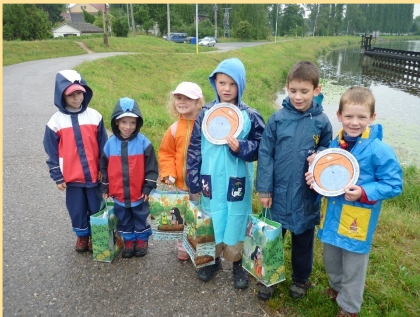
„Putování za pokladem 2011“