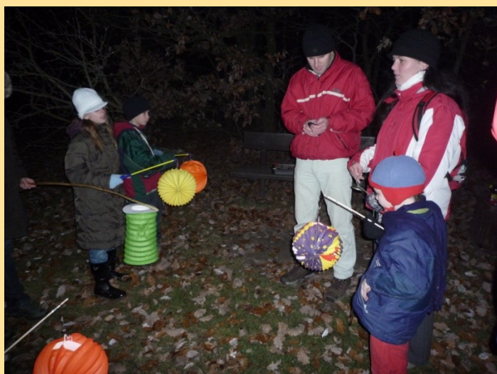
„Putování za proutky“